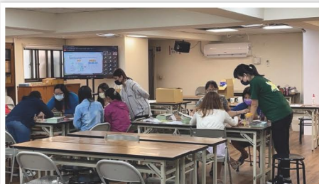
高雄場「環寶」桌遊體驗