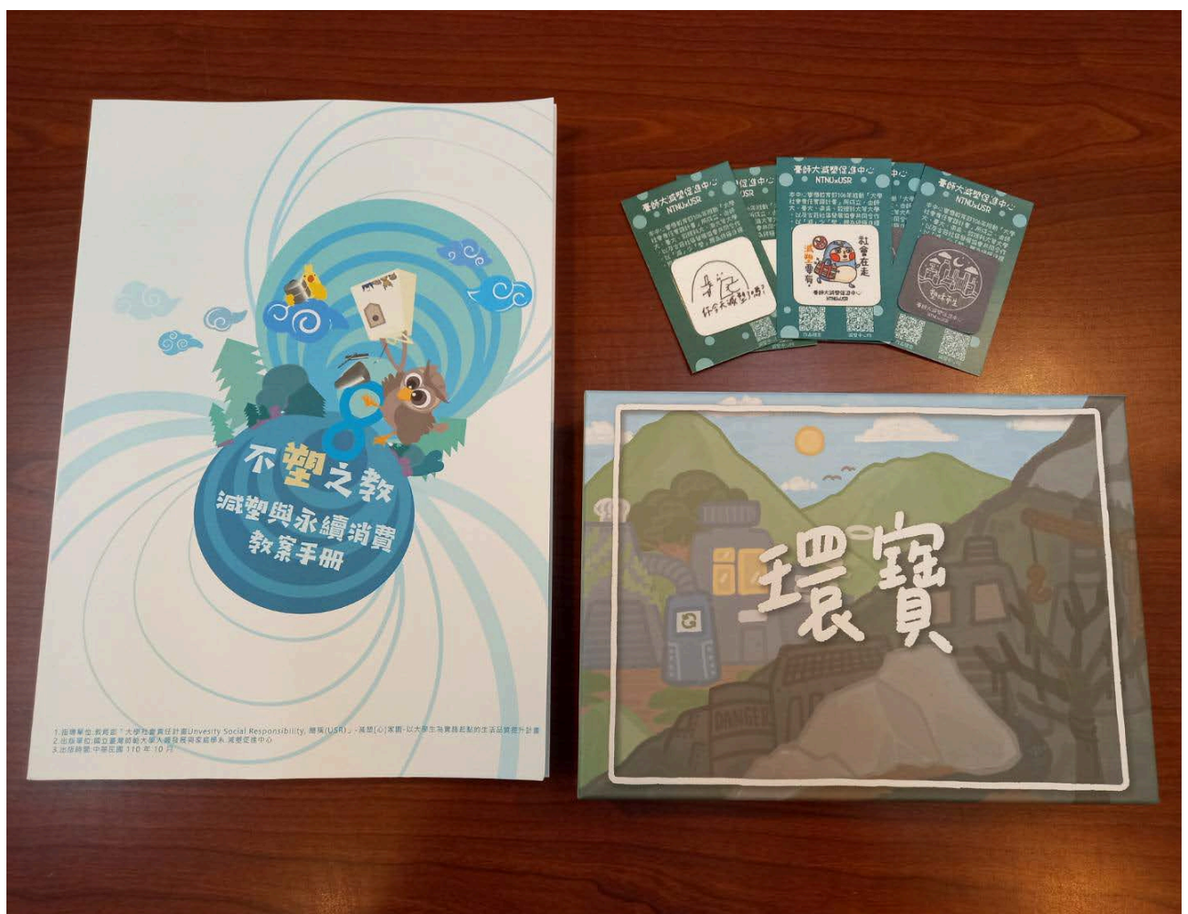
左：教案手冊、右上：螢幕擦拭貼、右下：環寶桌遊