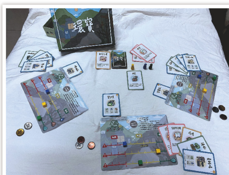
減塑促進中心今年將「我行我不塑」全國徵件比賽桌遊項目第一名作品，繼續研發開展成實際媒材，期望透過桌遊的新興推廣模式，傳達永續消費的價值與重要。

透過本次研習也引發老師們對於環境永續議題的熱情與參與動力，「透過桌遊提供建立孩子環保概念另一種方式！」、「減塑是長期奮鬥，大家加油！」、「感謝主辦單位用心，我相信透過這款桌遊，學生更能直接體會並產