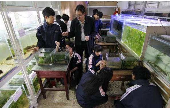
原生種魚類復育課程