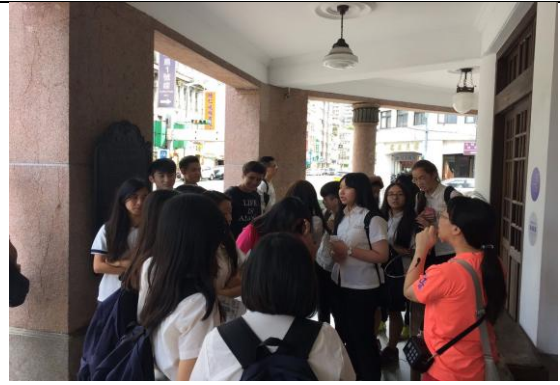
探索式多元選修課程(走訪大稻埕)