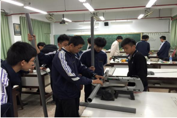
探索式多元選修課程(玩物理)