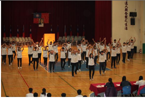
高一各班中正操競賽