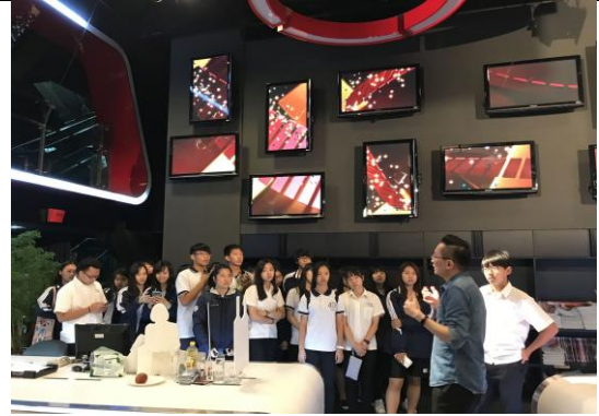
探索式多元選修課程(參訪媒體電臺)