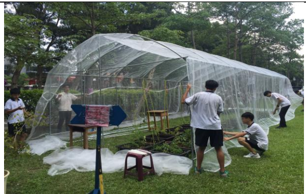
蝶類繁殖溫室搭建課程